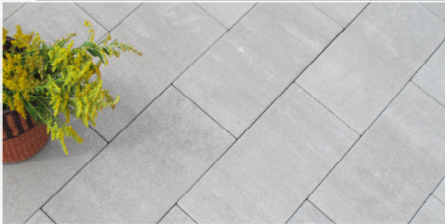
ACERA Terrassenplatten 50x25 cm Farbe: grau nuanciert Verlegung: Läuferverband