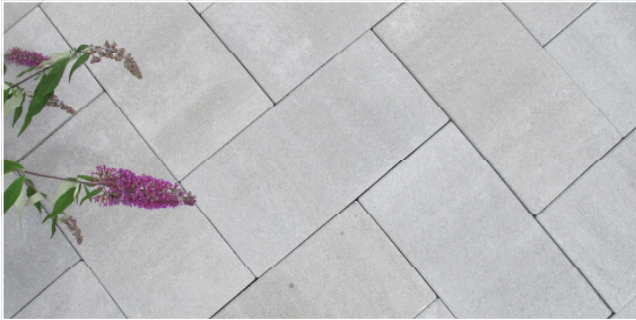
ACERA Terrassenplatten 50x25 cm Farbe: grau nuanciert Verlegung: Fischgrätverband