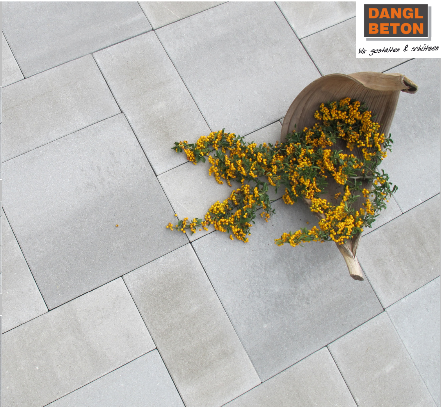
ACERA Terrassenplatten 50x50, 50x25 cm Farbe: grau nuanciert

Alle Produkte werden aus natürlichen Materialien hergestellt, Farbabweichungen sind möglich. Druckfarben können von den realen Farben abweichen.